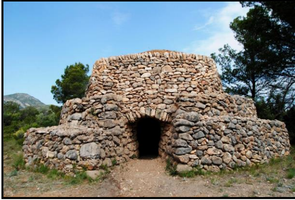
Barraca del Jaume de la Cota