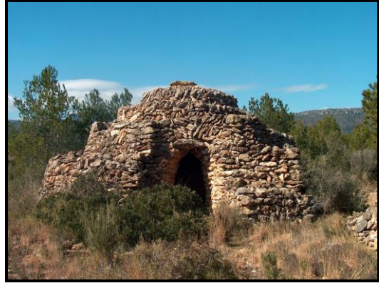
Barraca de l'espinal