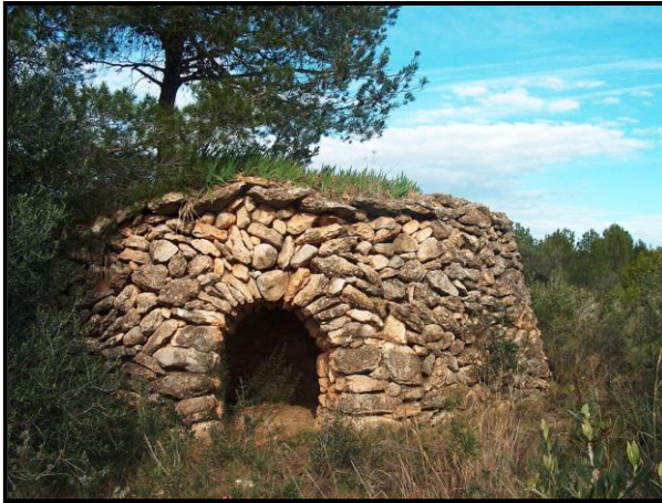
Barraca dels lliris