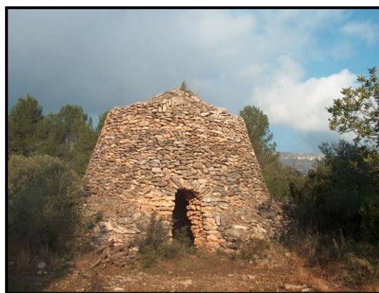
Barraca dels Comuns del Pellicer